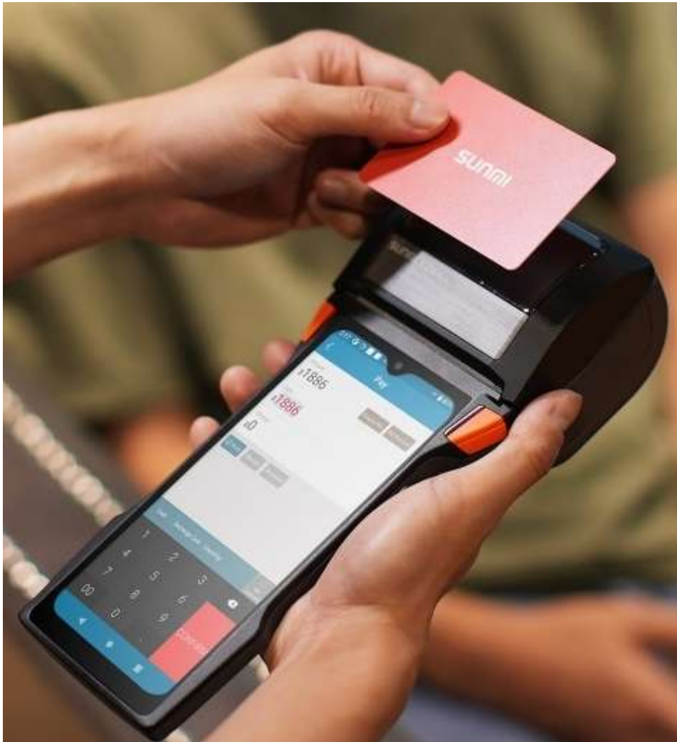
Sunmi V2s Plus.

Scherm 6.22", Octa-Core proc. Android111, BT/Wifi, 3/32Gb, 2D scanner 1x USB-C, AC, printer term. 50x80br, Batt. 2580mAh, gew: 350gr. 4G Sim slot.